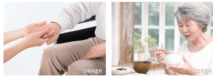
【共同設備】 食堂／浴室／談話室／洗濯室 エレベーター