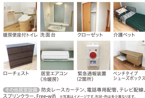
その他居室設備 防災レースカーテン、電話専用配管、テレビ配線、スプリンクラー、Free-wifi ※写真はイメージです。形状・色は多少異なります。