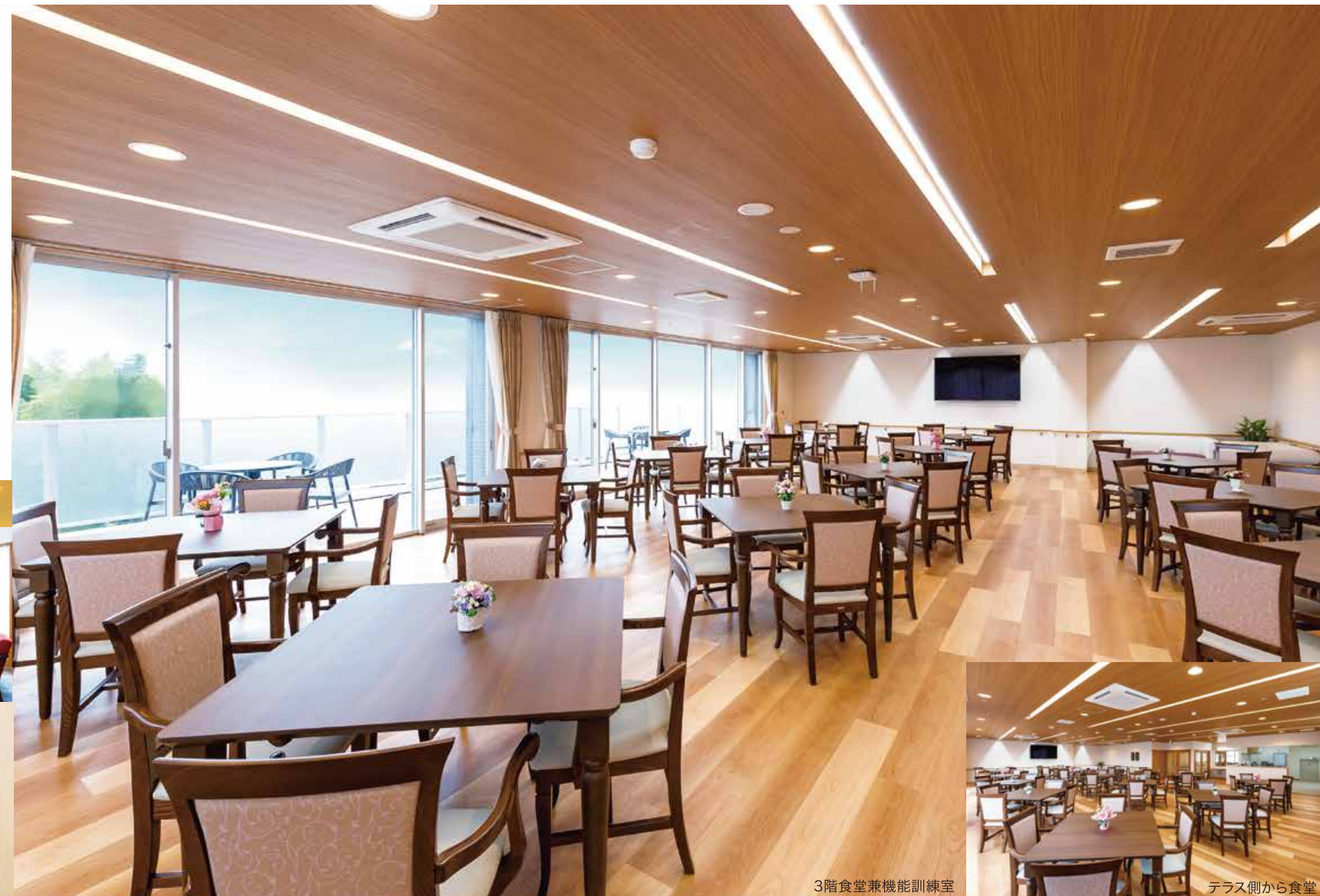
3階食堂兼機能訓練室