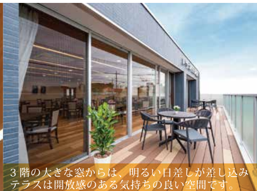
3階の大きな窓からは、明るい日差しが差し込みテラスは開放感のある気持ちの良い空間です。