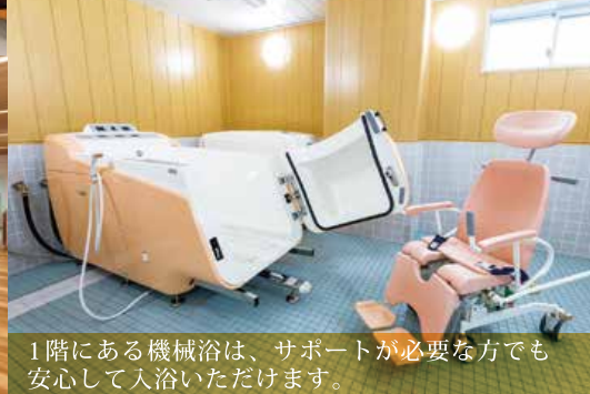
1階にある機械浴は、サポートが必要な方でも安心して入浴いただけます。