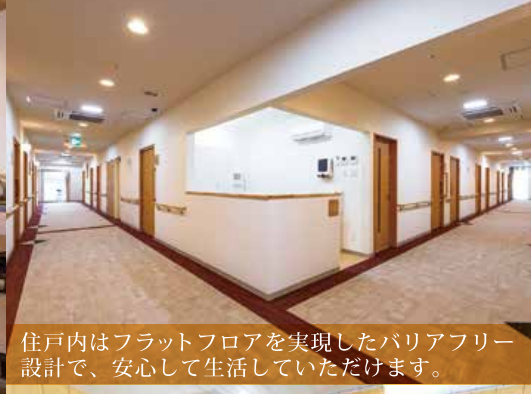
住戸内はフラットフロアを実現したバリアフリー設計で、安心して生活していただけます。