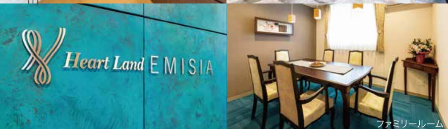
ファミリールーム