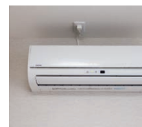
居室エアコン(冷暖房)