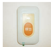
緊急通報装置(2箇所)