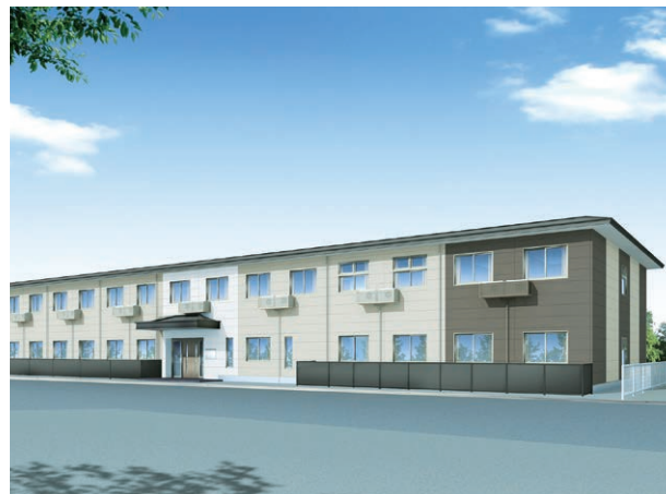
外観イメージ/土地・建物の所有形態:事業主体非所有