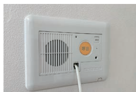
緊急通報装置(2箇所)