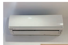
室内エアコン(冷暖房)