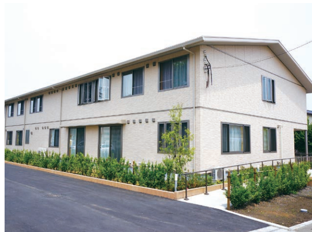
土地・建物の所有形態:事業主体非所有