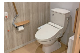
暖房便座付トイレ