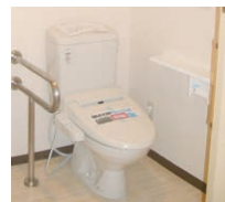
暖房便座付トイレ