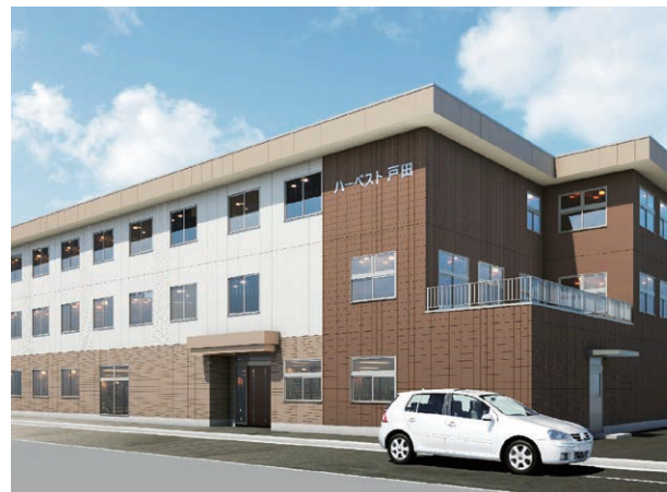
外観イメージ／土地・建物の所有形態：事業主体非所有