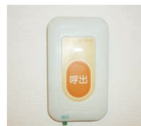
緊急通報装置(2箇所)