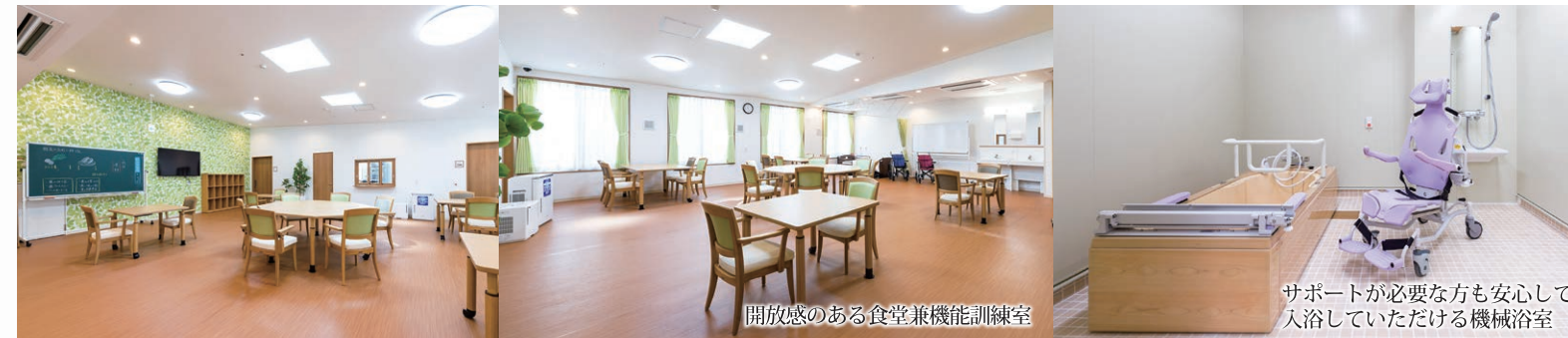
開放感のある食堂兼機能訓練室 サポートが必要な方も安心して入浴していただける機械浴室