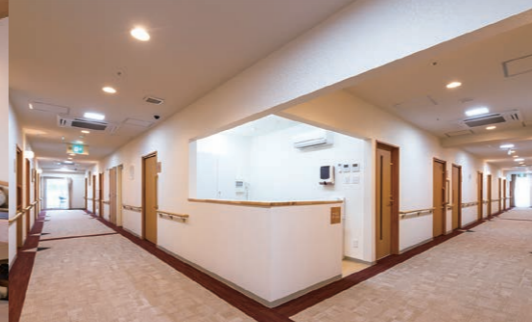
住戸内はフラットフロアを実現したバリアフリー設計で、安心して生活していただけます。