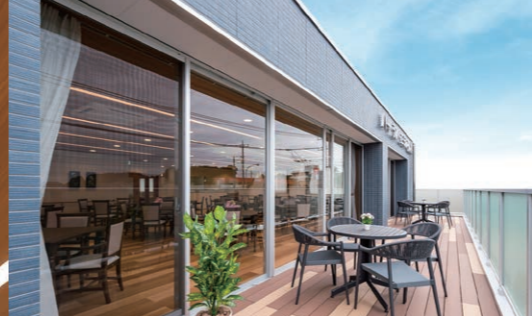
3階の大きな窓からは、明るい日差しが差し込みテラスは開放感のある気持ちの良い空間です。