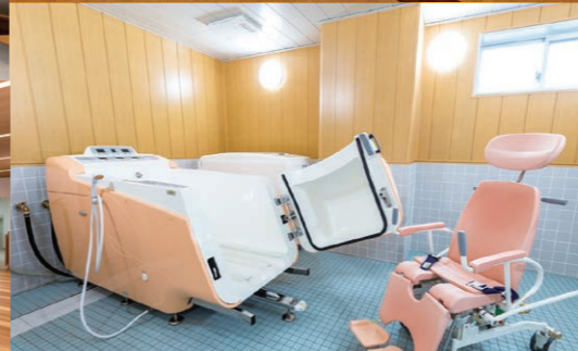
1階にある機械浴は、サポートが必要な方でも安心して入浴いただけます。