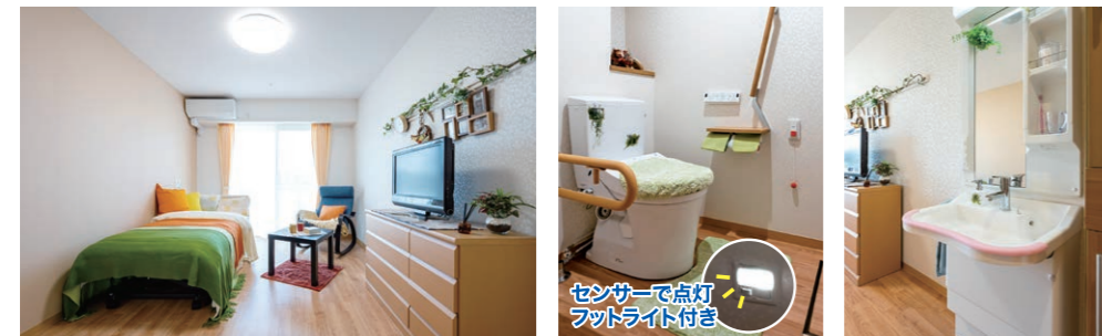
居室イメージ 暖房洗浄機能付きトイレ 洗面台

全室バルコニー付きの明るい室内は、高齢者の方でも使いやすく安心して暮らせる安全設計です。トイレ・洗面台・収納家具付きの個室で、プライバシーにも配慮。緊急通報装置や手すりも設置されており、日々の生活をやさしく支えてくれます。