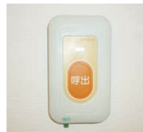
緊急通報装置(2箇所)