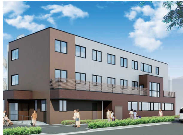
外観イメージ/土地・建物の所有形態:事業主体非所有