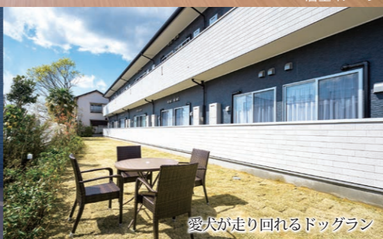
愛犬が走り回れるドッグラン