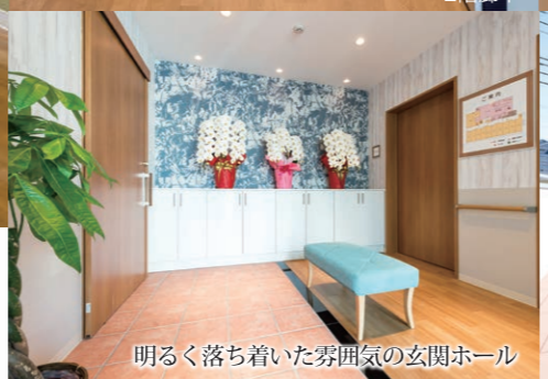
明るく落ち着いた雰囲気のある玄関ホール