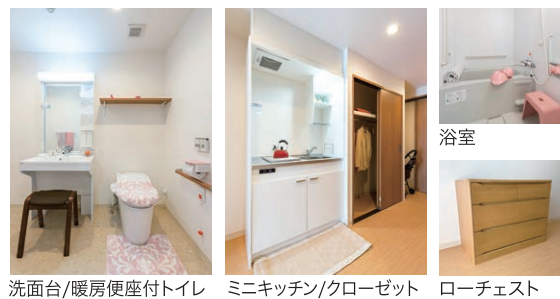
洗面台/暖房便座付トイレ ミニキッチン/クローゼット ローチェスト