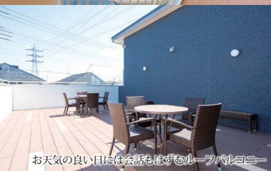
お天気の良い日には会話もはずむルーフバルコニー