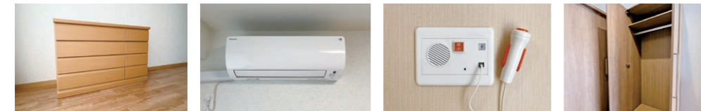
ローチェスト 居室エアコン(冷暖房) 緊急通報装置(2箇所) クローゼット