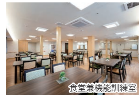
食堂兼機能訓練室