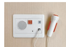
緊急通報装置(2箇所)