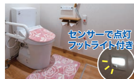
暖房洗浄機能付きトイレ