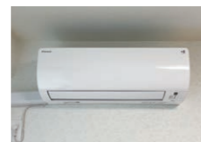
居室エアコン(冷暖房)